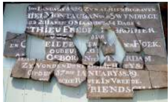
Grafsteen van drie verdronkenen 1829 – Moerkapelle