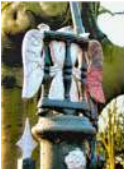
Geveugelde zandloper hek Begraafplaats Nieuwerkerk

Intussen gaat in 2017 het ruimen nog steeds door zonder de vereiste gemeentelijke lijst.