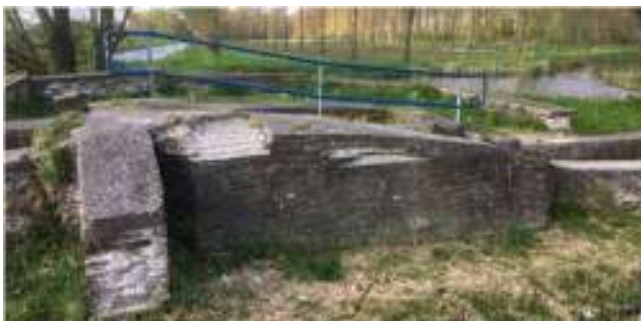
Essemolen fundament – Hitlandgebied Nieuwerkerk

Dit zijn initiatieven van vele organisaties die geld kosten maar die zichzelf ook op den duur terug betalen. De benodigde kennis voor informatievoorziening is aanwezig bij de historisch organisaties, Wij zijn overigens vertegenwoordigd in het bestaande recreatieplatform.