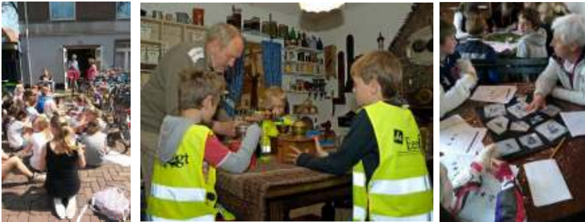
Schoolbezoeken aan de diverse oudheidkamers

Tijdens de nationale Open Monumentendag verzorgen de organisaties educatieve informatie omtrent het nationale jaarthema van Open Monumentendag en over de monumenten in de gemeente Zuidplas.