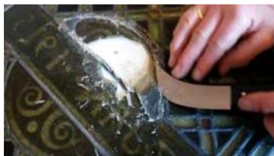
Restaureren van objecten