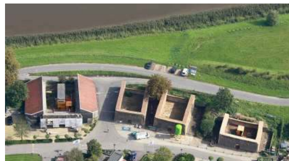
Luchtfoto steenovens Klein-Hitland 2010 Nieuwerkerk