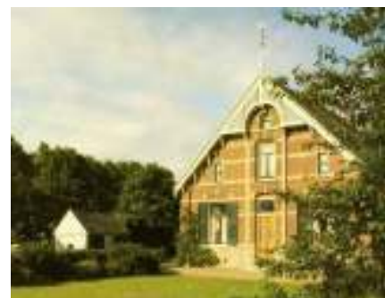
Drie voorbeelden van bedreigde monumenten waarvoor de historische organisaties zich inzetten. De Snelle sluis bij Moordrecht, de verkrottende Geertruidahoeve in Nieuwerkerk en de met succes behouden wagenschuur bij 't Land Kanaän in Zevenhuizen.