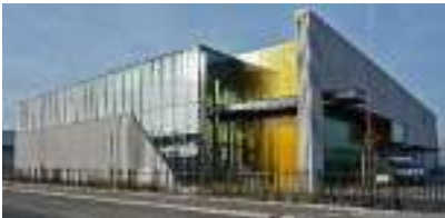
Het Gouwedepot van het archief

Zuidplas participeert, ter uitvoering van de Archiefwet 1995, als één van de vijf gemeenten in het Streekarchief Midden-Holland te Gouda (met Gouwedepot in Zuidplas!). De historische organisaties nemen deel met lidmaatschappen in de adviescommissie/klantenraad van het archief. Zij dragen er tevens zorg voor dat niet-overheidsarchieven die van historisch belang zijn in het archief worden onder gebracht.