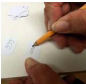
Registreren van objecten

De oudheidkamers streven naar een professionele aanpak zowel op het gebied van collectiebeheer, tentoonstellen, registratie als publieksbegeleiding.